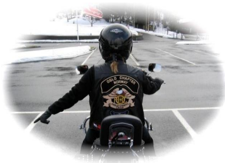
FARE I VEIEN VENSTRE SIDE

Håndsignaler bør være kjent for og brukes av alle førere. Når et signal gis av føreren foran deg er det din plikt å føre dette videre bakover til gruppen, slik at alle er informert. Dette er håndsignaler som har vært brukt i flere MC klubber i USA med bra resultater ved kjøring over lange distanser. Det er viktig at alle medlemmene lærer seg disse signalene.