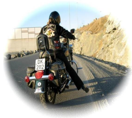
FARE I VEIEN HØYRE SIDE